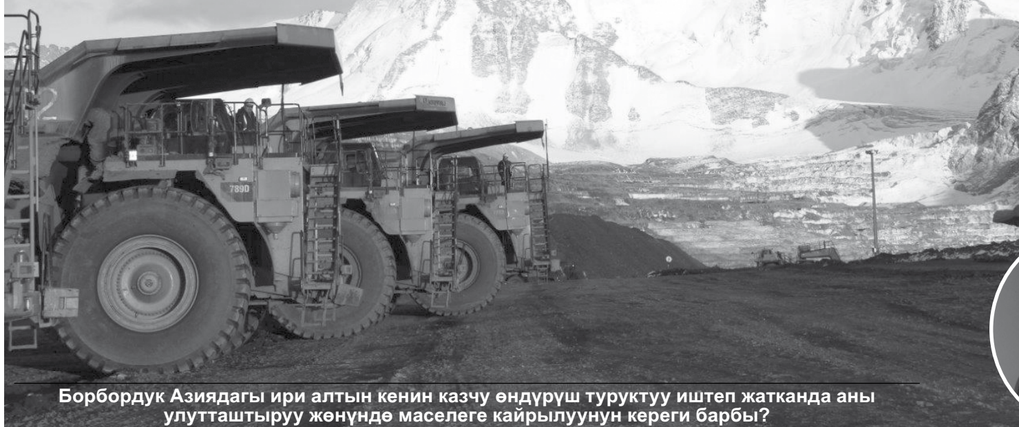
Борбордук Азиядагы ири алтын кенин казчу өндүрүш туруктуу иштеп жатканда аны улутташтыруу жөнүндө маселеге кайрылуунун кереги барбы?