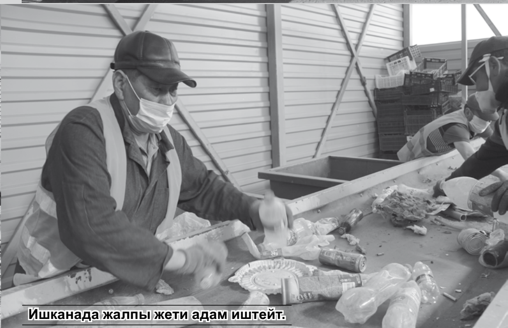
Ишканада жалпы жети адам иштейт.