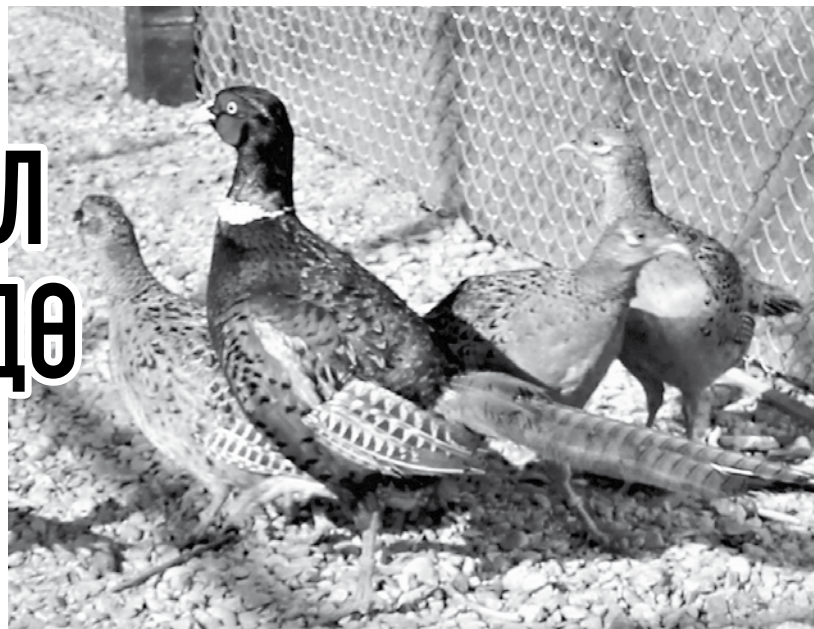
Кыргоол кам көрүүнү көп талап кылбайт.

Жети-Өгүз районунун Барскоон айылында аймактын био көп түрдүүлүгүн сактоо жана браконьердикке каршы күрөшүү үчүн демонстрациялык кыргоол өстүргөн жай түзүлдү. Бул уникалдуу фермага “Кумтөрдүн” жаңылыктары” дагы өз көзү менен күбө болуп кайтышты.