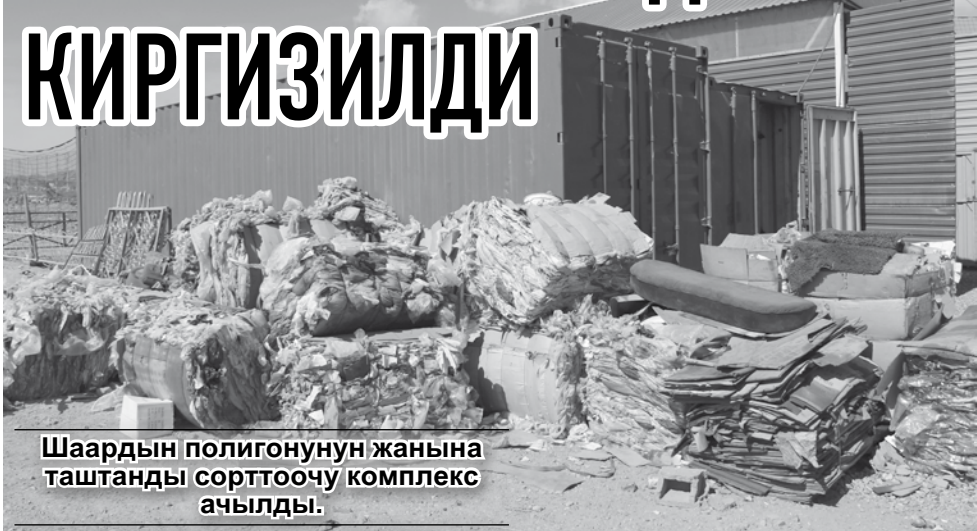
Шаардын полигонунун жанына таштанды сорттоочу комплекс ачылды.