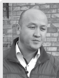
“Кумтөрдүн” аймактык өкүлү долбоордон чоң жыйынтыктардын күтүлгөнүн билдирди.

дик түрү катары кароодо. Ушул этапта эле айылдыктардын чоң кызыгуусу бар экенин байкадык, ошондуктан долбоордон көп нерсени күтүп жатабыз.