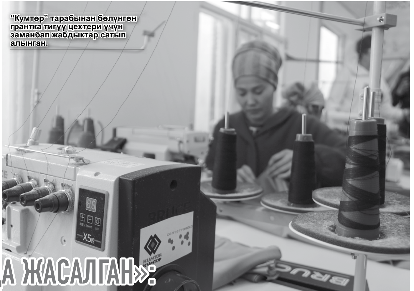
“Кумтөр” тарабынан бөлүнгөн грантка тигүү цехтери үчүн заманбап жабдыктар сатып алынган.

Ысык-Көл облусунда “Кумтөр” компаниясынын каржылоосунда тигүү бизнесине колдоо көрсөтүү боюнча программа ишке ашырылды. Көлөмдүү долбоордун катышуучулары кошумча жумуш орундарын түзүү менен бирге, өндүрүштөрүн кеңейтүү жана ири россиялык импортерлордун туруктуу буйрутмаларын алуу мүмкүнчүлүгүнө ээ болушту.