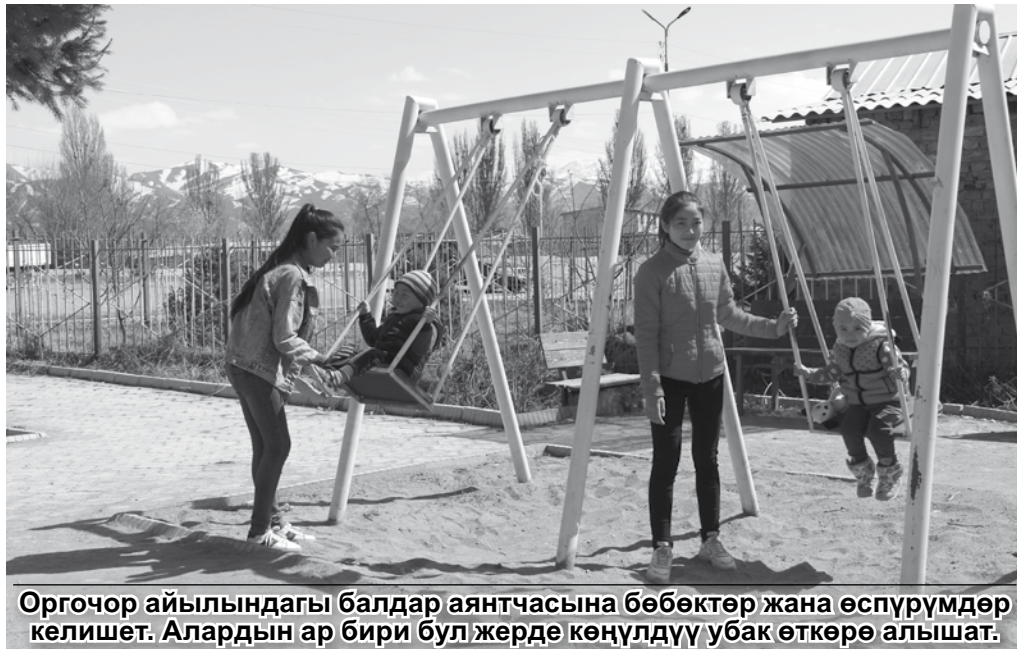
Оргочор айылындагы балдар аянтчасына бөбөктөр жана өспүрүмдөр келишет. Алардын ар бири бул жерде көңүлдүү убак өткөрө алышат.

“Кумтөрдүн” өсүп келе жаткан муунга колдоо көрсөтүүгө багытталган социалдык долбоору үчүн ураан ойлоп табуу керек болсо, ал так ушундай болмок. Компания өлкөнүн жаркын келечеги болгон балдарга жана жаштарга көңүл буруу канчалык маанилүү экенин өзүнүн мисалында көрсөтөт.