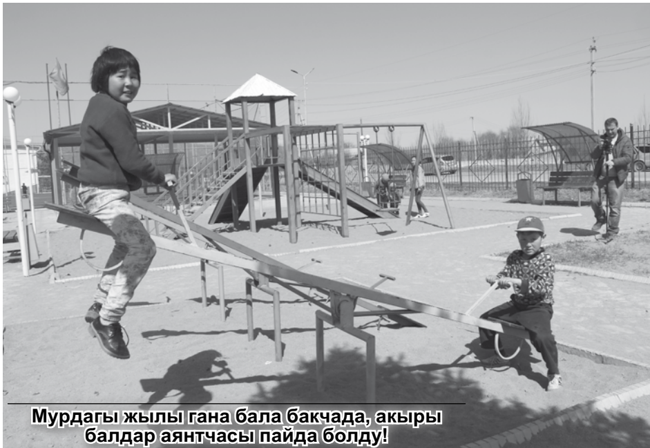
Мурдагы жылы гана бала бакчада, акыры балдар аянтчасы пайда болду!