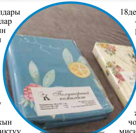
Балыкчыдагы тигүү цехинде шейшептердин комплекти тигилүүдө.