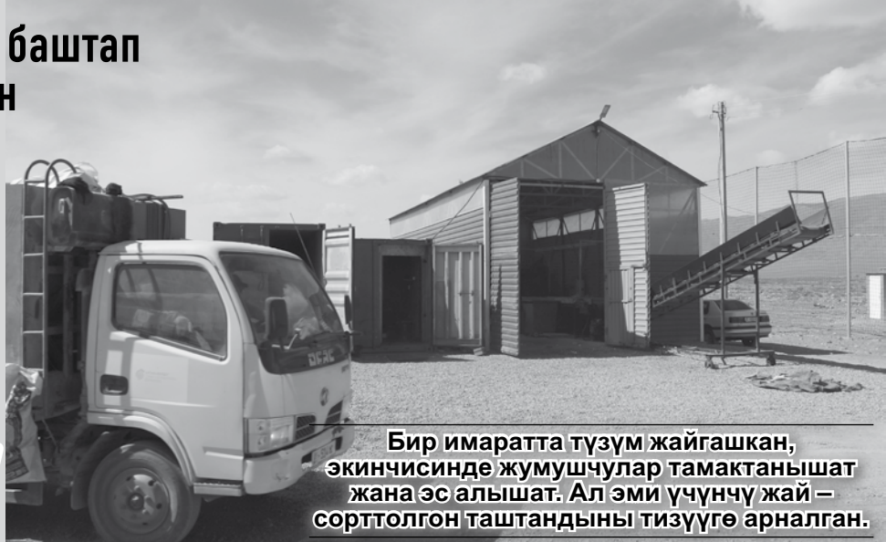
Бир имаратта түзүм жайгашкан, экинчисинде жумушчулар тамактанышат жана эс алышат. Ал эми үчүнчү жай – сорттолгон таштандыны тизүүгө арналган.