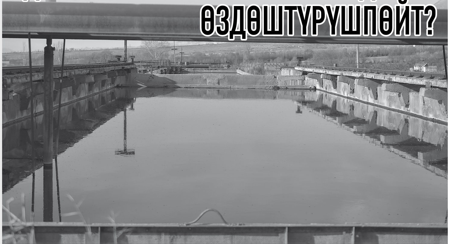
Ысык-Көл районундагы жаңы тазалоочу курулуштарды куруу жана зарыл жабдыктарды алмаштыруу маселеси курч бойдон турат. Кумтөрдүн төлөмдөрү бул маселени чечет деген үмүт болгон.

2017-ЖЫЛДАН ТАРТА КАНАДАЛЫК ИНВЕСТОР КЫРГЫЗСТАНГА ЭКОЛОГИЯЛЫК КӨЙГӨЙЛӨРДҮ ЧЕЧҮҮ ҮЧҮН ЖЫЛ САЙЫН 3,7 МЛН ДОЛЛАРДАН КОТОРУП КЕЛЕТ. БУЛ КАРАЖАТТАРДЫН КАНЧА БӨЛҮГҮ АЗЫРКЫ МЕЗГИЛГЕ ЧЕЙИН ЭКОЛОГИЯГА САРПТАЛГАН? ЖООБУ – БИР ДАГЫ ТЫЙЫН САРПТАЛГАН ЭМЕС.