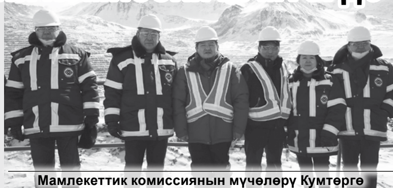
Мамлекеттик комиссиянын мүчөлөрү Кумтөргө текшерүү менен барышты.

“Кумтордун” иши боюнча 2012-2013-жылдардагы өткөрүлгөн эки мамлекеттик комиссиянын текшерүүсүнөн кийин, өлкө Өкмөтү ишкананы текшерүүгө АМЕК көз карандысыз британ компаниясын тарткан. Аталган компания текшерип бүткөндөн кийин 20 сунуштама даярдады. Бүгүнкү күндө алардын дээрлик баары аткарылды. Андан тышкары, 2020-жылдын октябрь айында ERM Consultants Canada Ltd компаниясы «АМЕКтин калган сунуштамаларынын» «Кумтөр» кенинде аткарылуу даражасын текшерип, «Кумтор Голд Компани» АМЕКтин калган сунуш-