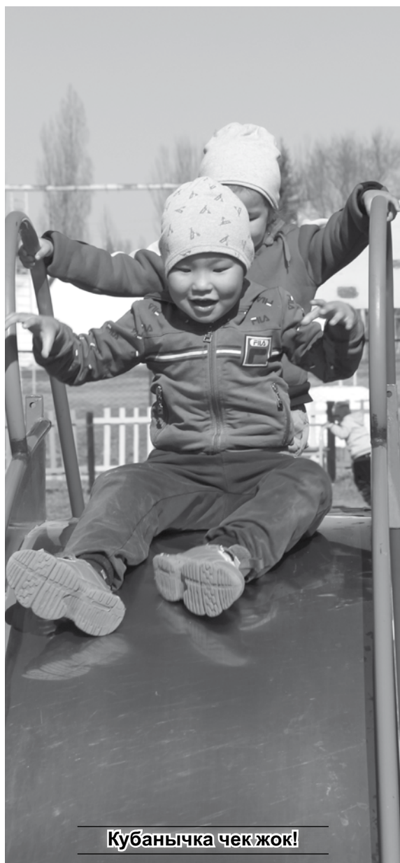
Кубанычка чек жок!

бала бакчанын жетекчиси көрсөткөн колдоосу үчүн инвесторго ыраазычылык билдирди.