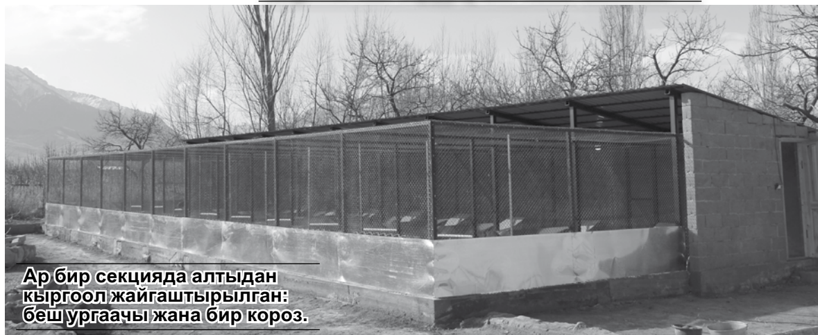
Ар бир секцияда алтыдан кыргоол жайгаштырылган: беш ургаачы жана бир короз.

3 млн 844 миң сом турган бул долбоор Жети-Өгүз районунун Барскоон айылын-