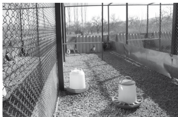
Алардын суулары күнүнө эки жолу алмаштырылат - бул кыргоолдорду багуунун милдеттүү шарты.