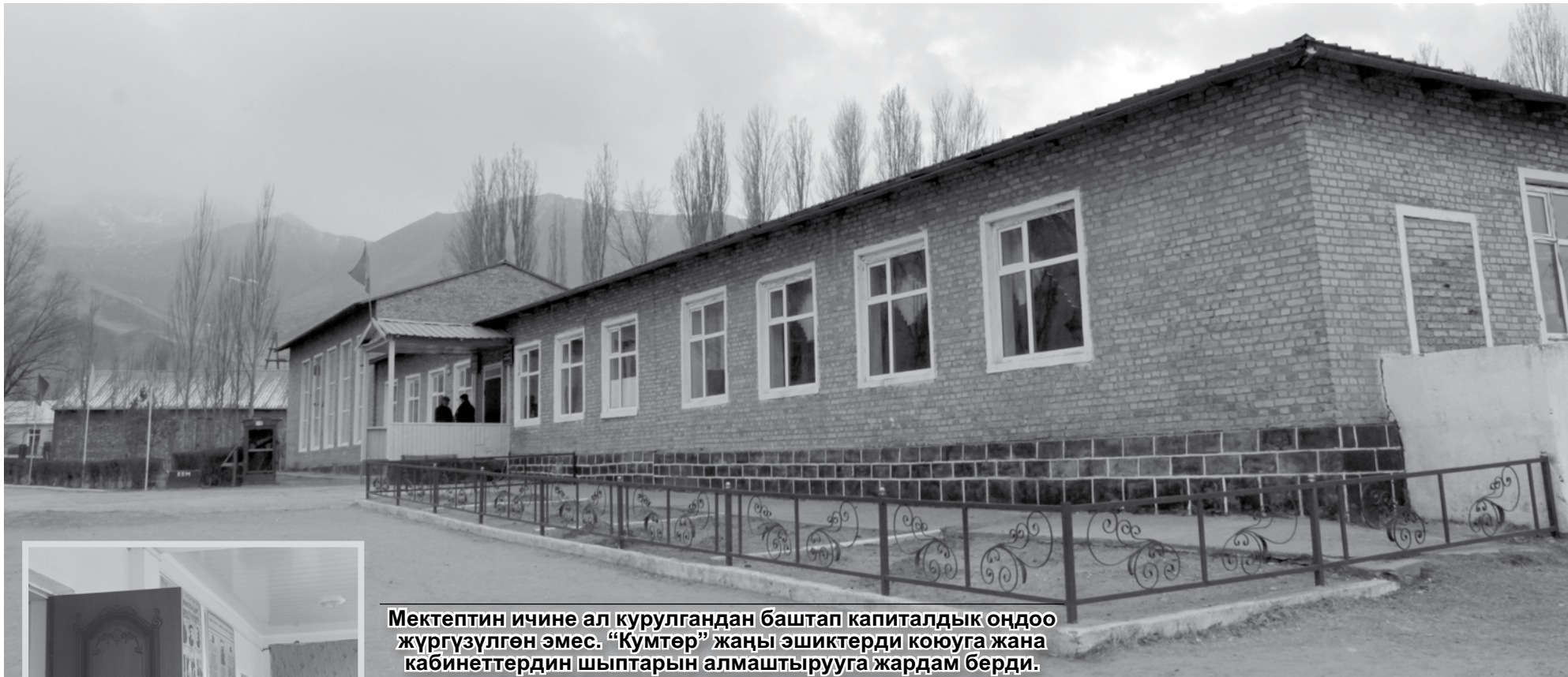
Мектептин ичине ал курулгандан баштап капиталдык оңдоо жүргүзүлгөн эмес. «Кумтөр» жаңы эшиктерди коюуга жана кабинеттердин шыптарын алмаштырууга жардам берди.