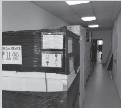
Жаңы жабдуу Улуттук онкология жана гематология борборунда ноябрь айынын башында алынып келинген.