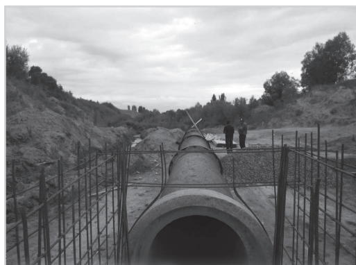
Зеленый Гай айылындагы жаңы дамба калктын сугат сууга жетүүсүнө мүмкүндүк берет.