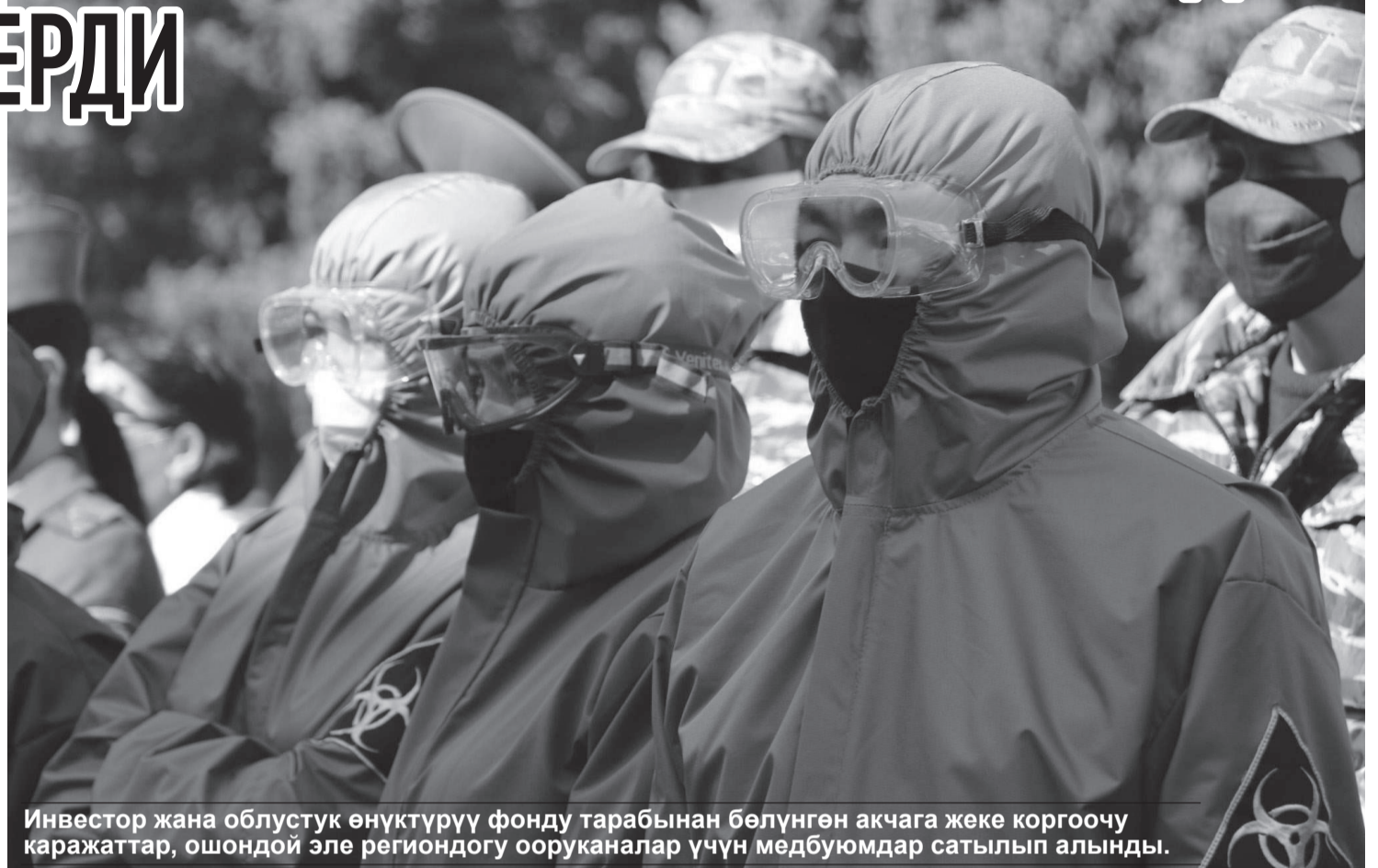
Инвестор жана облустук өнүктүрүү фонду тарабынан бөлүнгөн акчага жеке коргоочу каражаттар, ошондой эле региондогу ооруканалар үчүн медбуюмдар сатылып алынды.

Чогултулган каражаттардын башка бөлүгү Жети-Өгүз районунун Кызыл-Суу айылынын райондук ооруканасы үчүн эки муздаткыч жана ЖКК комплекттерин сатып алууга жумшалды. «МАК» жүк ташуучу унааларынын айдоочулары жана Балыкчыдагы өткөөл базанын кумтөрчү диспетчерлери Балыкчы аймактык шаардык ооруканасына жардам беришти. Өздөрүнүн күчү менен чогултулган 350 миң сомго алар дары, антисептик, жеке коргонуу каражаттарын жана эки кычкылтек концентраторун сатып алышты.