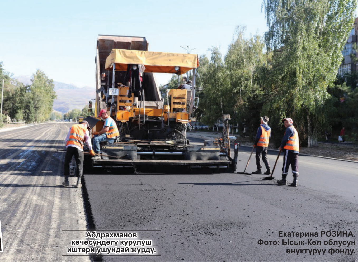
Абдрахманов көчөсүндөгү курулуш иштери ушундай жүрдү.