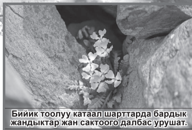
Бийик тоолуу катаал шарттарда бардык жандыктар жан сактоого далбас урушат.

«Кумтор Голд Компани» жыл сайын курчаган чөйрөнү коргоо жана туруктуу өнүктүрүү жөнүндө отчет жарыялайт. Инвестор жаратылышты коргоо иш-чараларын башкарууга жооптуу мамилени өз ишинин маанилүү бөлүгү катары эсептейт.