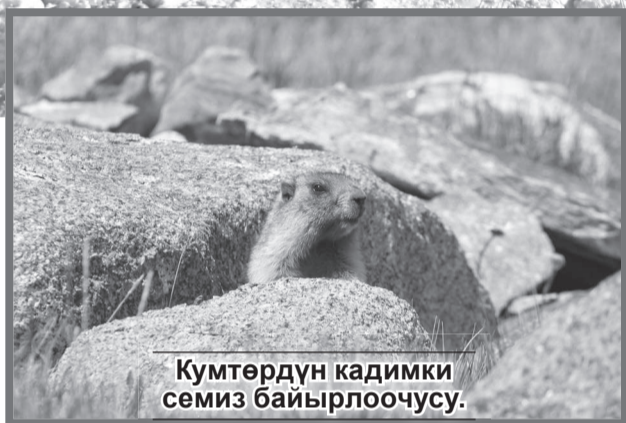
Кумтөрдүн кадимки семиз байырлоочусу.

«Кумтор Голд Компани» жыл сайын курчаган чөйрөнү коргоо жана туруктуу өнүктүрүү жөнүндө отчет жарыялайт. Инвестор жаратылышты коргоо иш-чараларын башкарууга жооптуу мамилени өз ишинин маанилүү бөлүгү катары эсептейт.