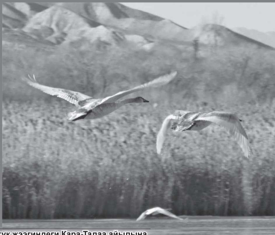
Ысык-Көлдүн түштүк жээгиндеги Кара-Талаа айылына жакын жерде жайгашкан жарым аралда уникалдуу канаттуулардын жүздөгөн түрлөрү жашайт.