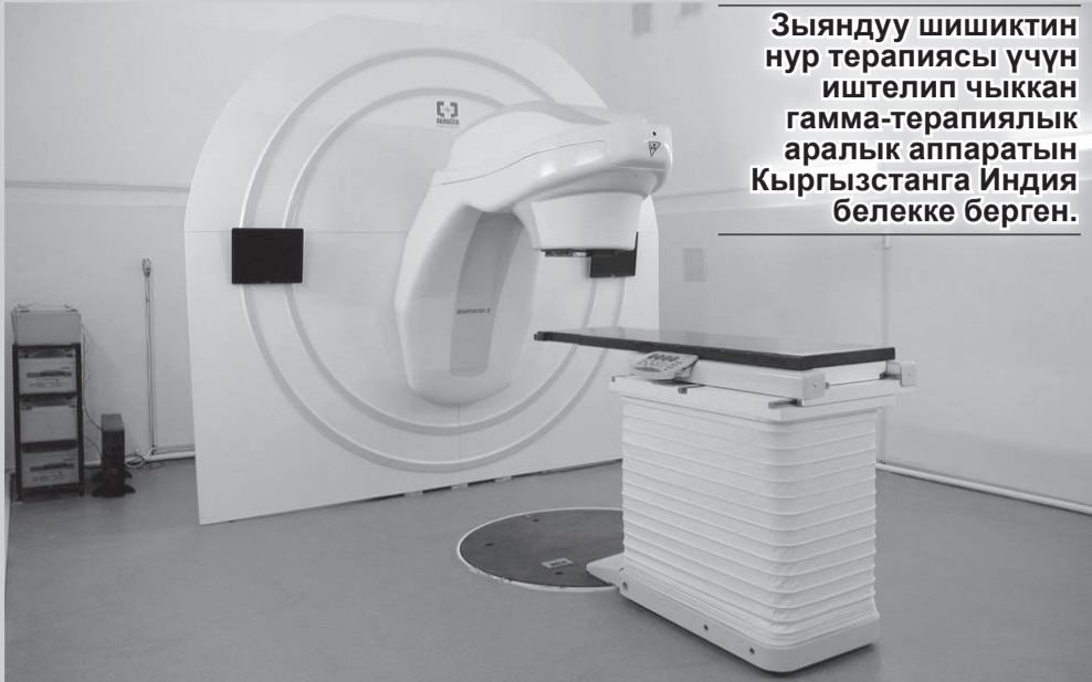
Зыяндуу шишиктин нур терапиясы үчүн иштелип чыккан гамма-терапиялык аралык аппаратын Кыргызстанга Индия белекке берген.

Кымбат баалуу медициналык жабдууларды сатып алууга акчаны «Кумтөр» компаниясы бөлүп берген.