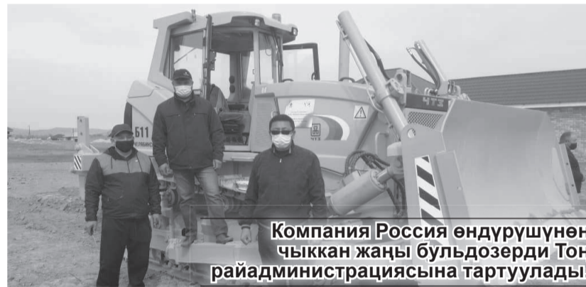
Компания Россия өндүрүшүнөн чыккан жаңы бульдозерди Тоң район администрациясына тартуулады.

Буудай рентабелдүү эмес айыл чарба азыгы болгондуктан, дыйкандар аны экпей калышкан. Бирок эгерде өлкөгө ун менен буудай сырттан ташылып келбей калса, калкты азык-түлүк менен камсыздоо үзгүлтүккө учурашы мүмкүн. Ошондуктан коңшуларга ишене бербей өз алдынча аракет кы-