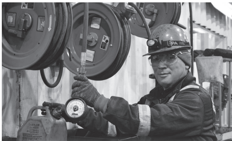
Кен жабылгандан кийин ири алтын казуучу ишканада иштеп бай тажрыйбага ээ болгон адистер жакынкы же алыскы чет өлкөлөрдөн оңой жумуш таап алышы мүмкүн. Бирок бөтөн жерге кимдин кеткиси келет?