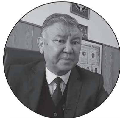
Улуттук борбордун башчысынын айтымында, эч кандай тоскоолдуктар болбосо, тилкелик тездеткичтер 2021-жылдын кыш мезгилинде иштей баштайт.

кыргыз тарап бир эле учурда эки аппаратты сатып алууну камсыз кылды: бири “эс алууда” болгондо, экинчиси иштеп турат.