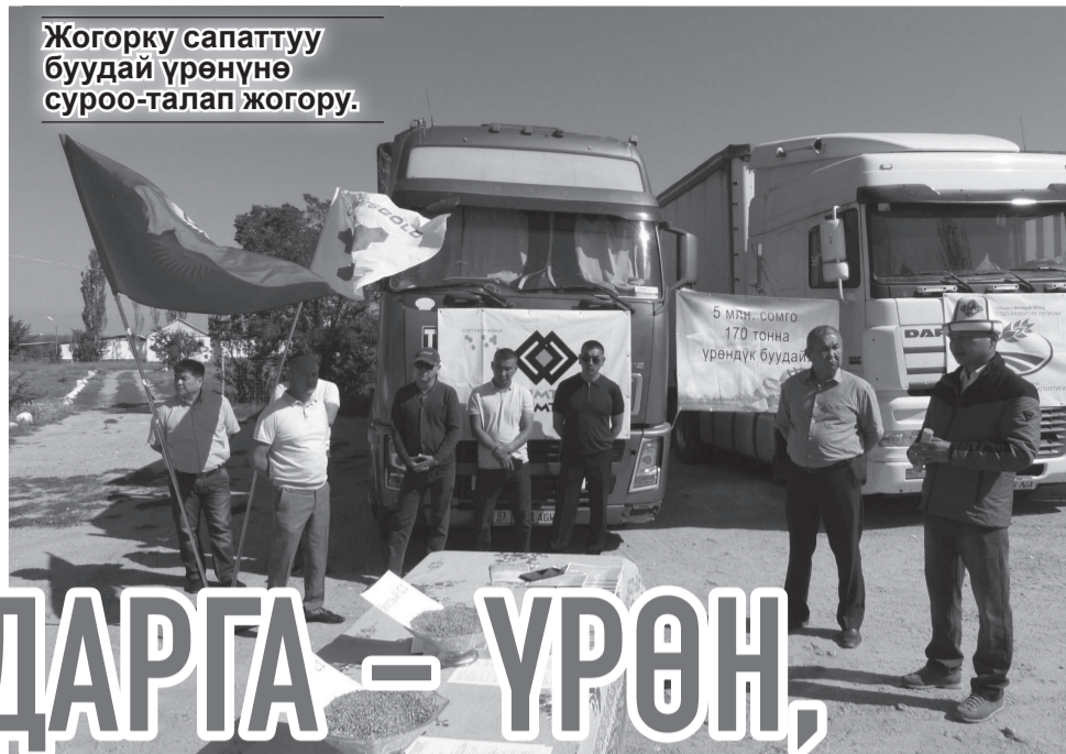
Жогорку сапаттуу буудай үрөнүнө суроо-талап жогору.

«Кумтөр» Ысык-Көл облусунда регионду өнүктүрүү жана айылдыктарды колдоо боюнча социалдык долбоорлорду өнүктүрүү менен бирге ишке ашырууну улантууда.