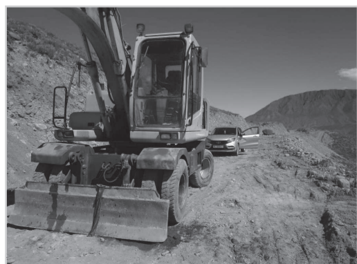
«Какыр» сугат каналынын курулушу талааларды сугаруу маселесин чечет.

160 адам жашаган Кажы-Саз айылында да суу түтүктөрүн капиталдык оңдоо иштери жүргүзүлөт. FSDS менен ишке ашырылуучу аталган долбоорго компания дээрлик 2,6 млн сом салым кошту.