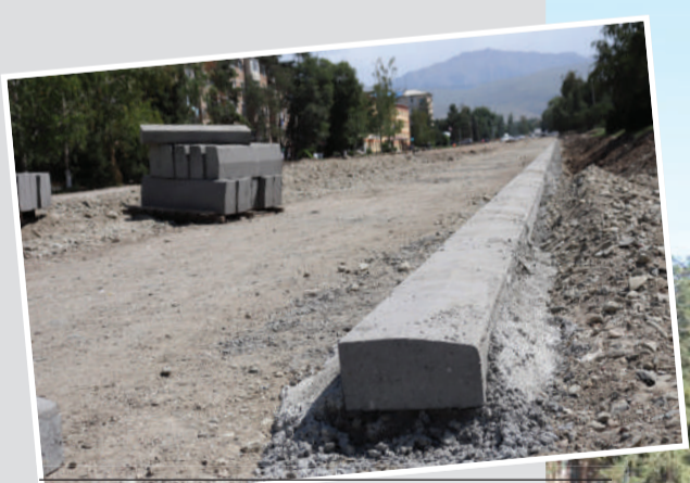
Ысык-Көл облусун өнүктүрүү фонду Караколдогу жолдорду жана тротуарларды реконструкциялоо боюнча эки ири долбоорду каржылайды.