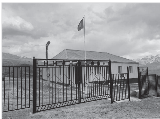
Инвестордун акчасына айыл өкмөтүнүн имараты оңдолуп, жылууланды.