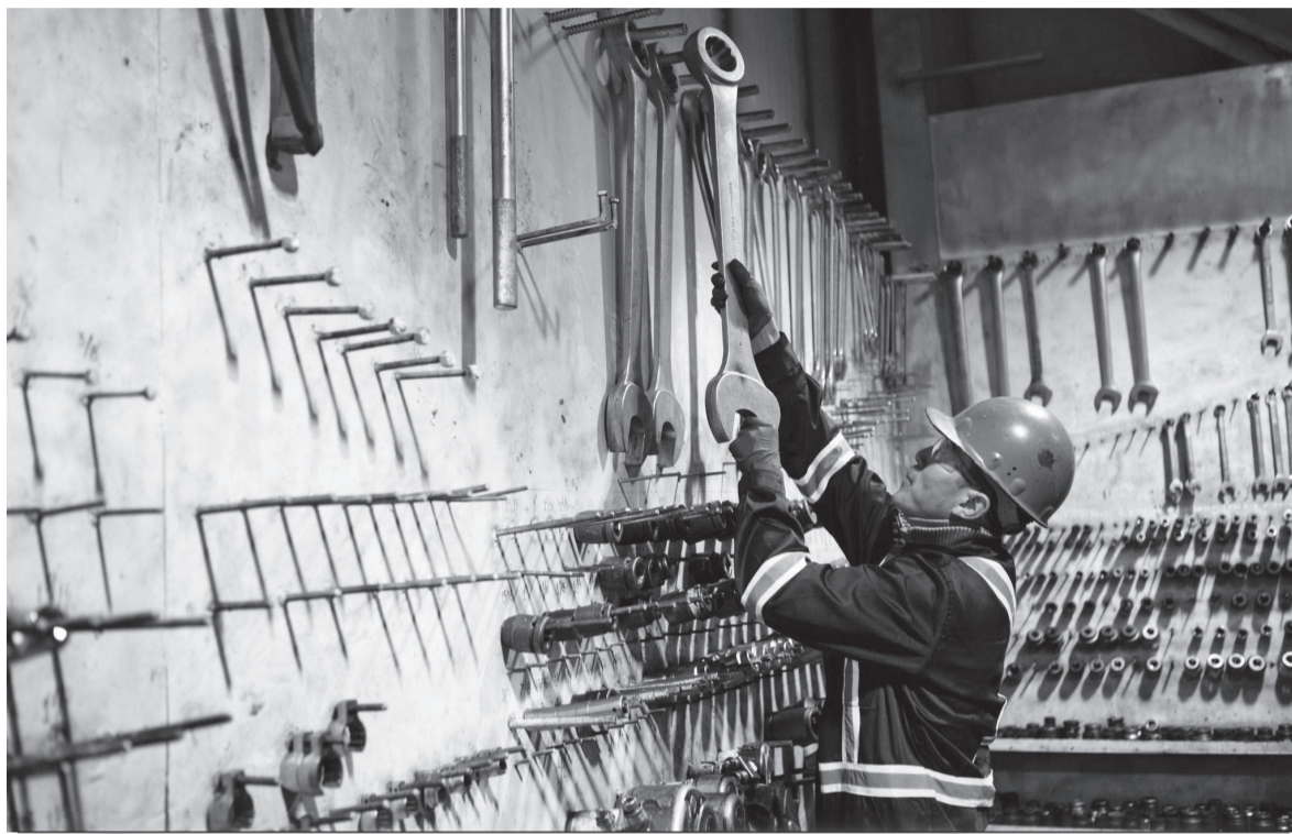
Ишканадагы коопсуздук техникасынын эрежелери дайыма кынтыксыз аткарылат. Ар бир кызматкер «Work Safe - Home Safe» коопсуздук программасы боюнча тренингден өттү.

Өлкөгө капчысынан кирип келген кооптуу жана айлакер душман менен алгач кездешкенде Кыргызстан алдастай түшкөн. Айрымдар коркунуч деле жок дешти. Башкалары “балким өтүп кетет” деген ойдо болду. Көзгө көрүнбөгөн душманды каршы алууга өз коопсуздугун биринчи орунга койгондор гана даярданышты окшойт. “Кумтөр” жаңылыктары кендин үзгүлтүксүз ишти камсыздоо жана коронавирустук инфекциясын жуктуруп алуу тобокелдигин болушунча төмөндөтүү үчүн алтын казуучу ишканада чаралар көрүлгөнүнөн кабардар болду. Албетте, туруктуу иштеген кызматкерлеринин саны эле 2600дөн ашкан “Кумтөр” сыяктуу ири компанияда ал абдан эле кооптуу болчу.