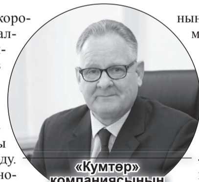
«Кумтөр» компаниясынын президенти Деон Баденхорст компаниянын финансылык колдоосу Кыргызстандын саламаттык сактоо системасын жакшыртууга мүмкүндүк берерине ишенерин айтты.

Караколдогу оорукана үчүн жаңы медициналык жабдууларды сатып алууга фонд 9 млн 911 миң сом бөлүп берди.