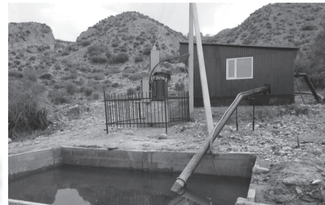
Эшперовдогу суу тартыштыгы чечилди. Инвестор Совет мезгилинде курулган насостук станцияны оңдоого жардам берди.

Айылда 2 504 адам жашайт. Талаада иштеп оор түйшүк менен нан таап жешет. Жагымдуу климат дыйкандарга жашылча-жемиштерден мол түшүм алууга мүмкүндүк берет. Албетте, кыйынчылыктары да бар. Эшперовдо 83 гектар сугат жер жана 82 короо жайга танапташ участок бар. 90-жылдарга чейин, колхоз учурунда эле, калктуу конуштун түндүк-батыш бөлүгүн Ак-Сай дарыясынан сугарышкан. Суу насостун жардамы менен берилген. Ал эми Союз урагандан кийин колхоз жерлерин үлүш участкаторуна бөлүп, айылдыктарга берип коюшту. Насос станциясы бара-бара колдонуудан чыгып, жабдуулар жана тетиктери эскирип кеткен. Жыл сайын сугат суу таргыш болуп турган. Суткалык жөнгө