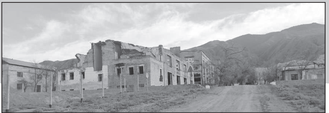
Кажы-Сайдын каралбай калган электротехникалык заводунун чалдыбары чыккан имараты көргөн көзгө кунарсыз болуп жаман таасир калтырат.