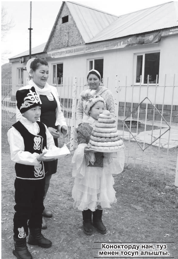
Конокторду нан, туз менен тосуп алышты.