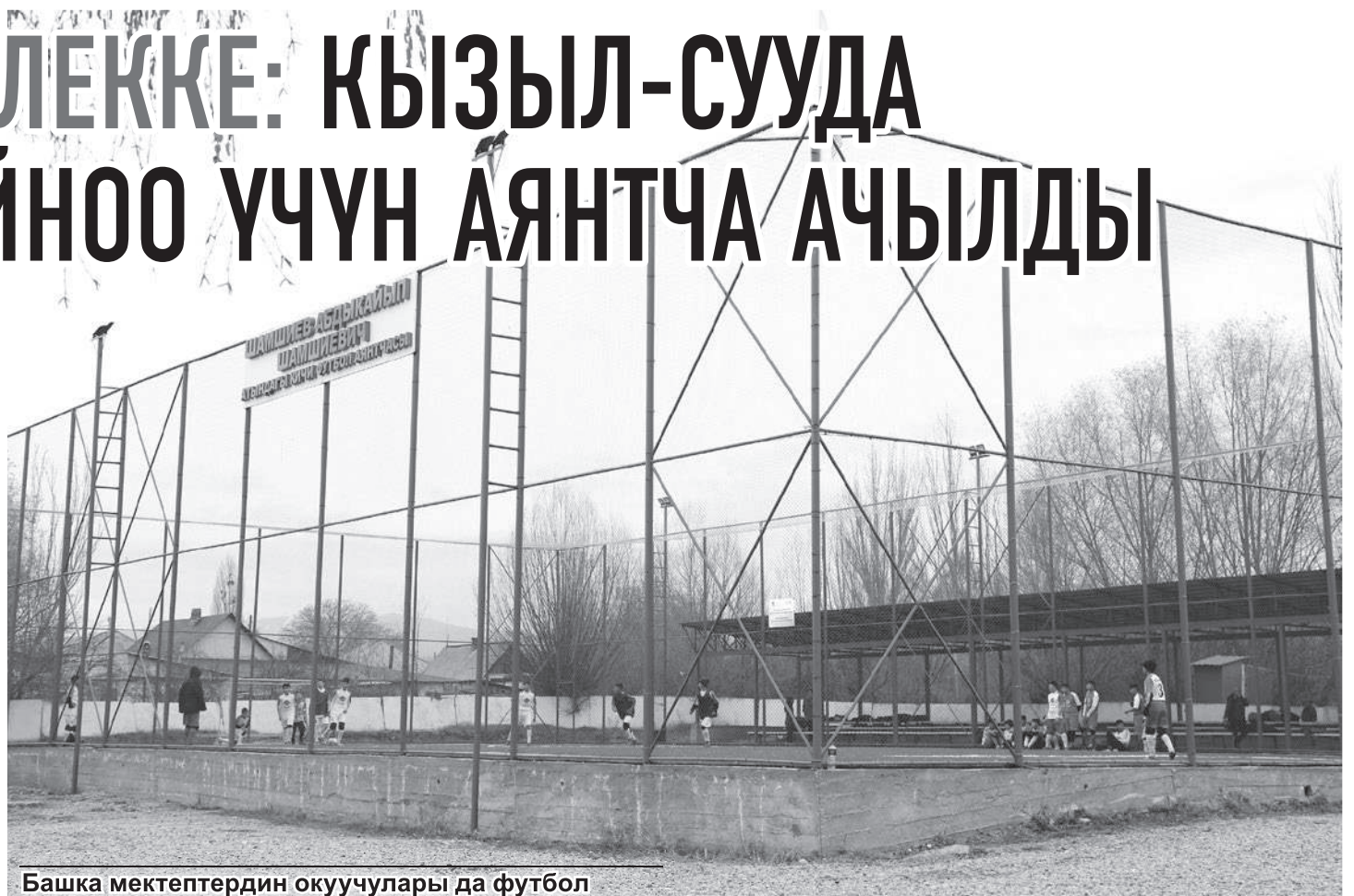
Башка мектептердин окуучулары да футбол аянтчасында машыга алышат. Таптакыр бекер!

Кызыл-Суудагы футбол аянтчасы компаниянын жалгыз эле долбоору эмес. Мына ушундай жакшынакай футбол аянтчалары инвестордун жана Ысык-Көл өнүктүрүү фондунун колдоосу менен Жети-Өгүз районунун Оргочор, Саруу, Барскоон жана Чычкан айылдарында ачылган. “Кумтөр” өзүнүн негизги өндүрүштүк ишмердүүлүгүн жүргүзгөн Ысык-Көл аймагындагы жаш муундун өнүгүүсүнө өзгөчө көңүл буруп келет. Ал жаштар менен бир толкунда! Кыргызстандын курама командасынын бир нече жолку салтанаттуу жеңишинен кийин өлкөдө футбол аябай популярдуулукка жетти. Мына ушул кызыгуу өчүп калбасы үчүн алтын казуучу компания аны колдоого дайым даяр. Ким билсин, мүмкүн, ка-