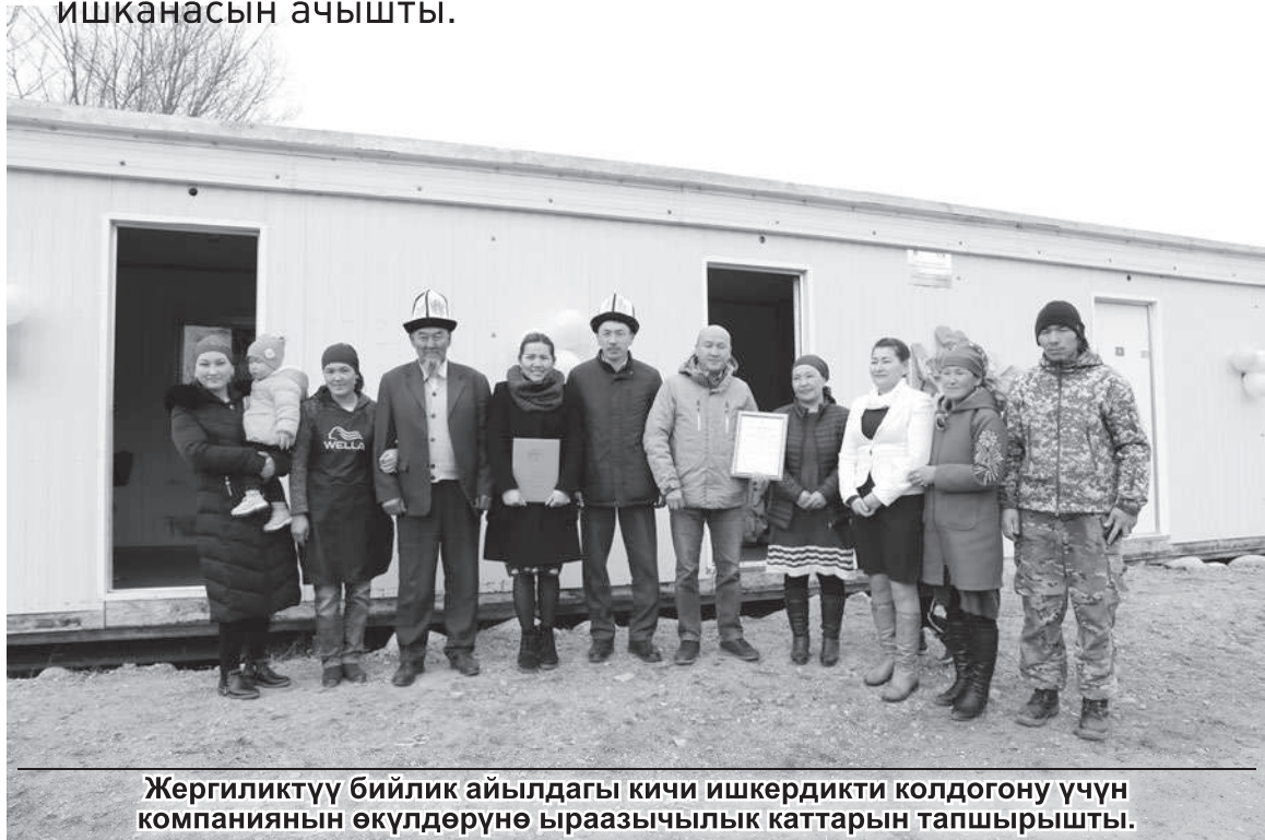
Жергиликтүү бийлик айылдагы кичи ишкердикти колдоону үчүн компаниянын өкүлдөрүнө ыраазычылык каттарын тапшырышты.

Жети-Өгүз районунун Кургак-Айрык айылынын тургундары “Кумтөрдүн” колдоосу астында тигүү боюнча кичи өндүрүш ишканасын ачышты.