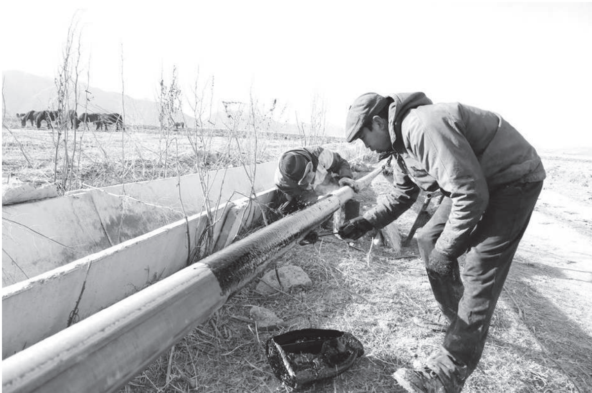
Ичүүчү суунун кошумча тармагы үчүн жаңы түтүктөрдү коюу иштерин жумушчулар суук түшкүчө аякташты.