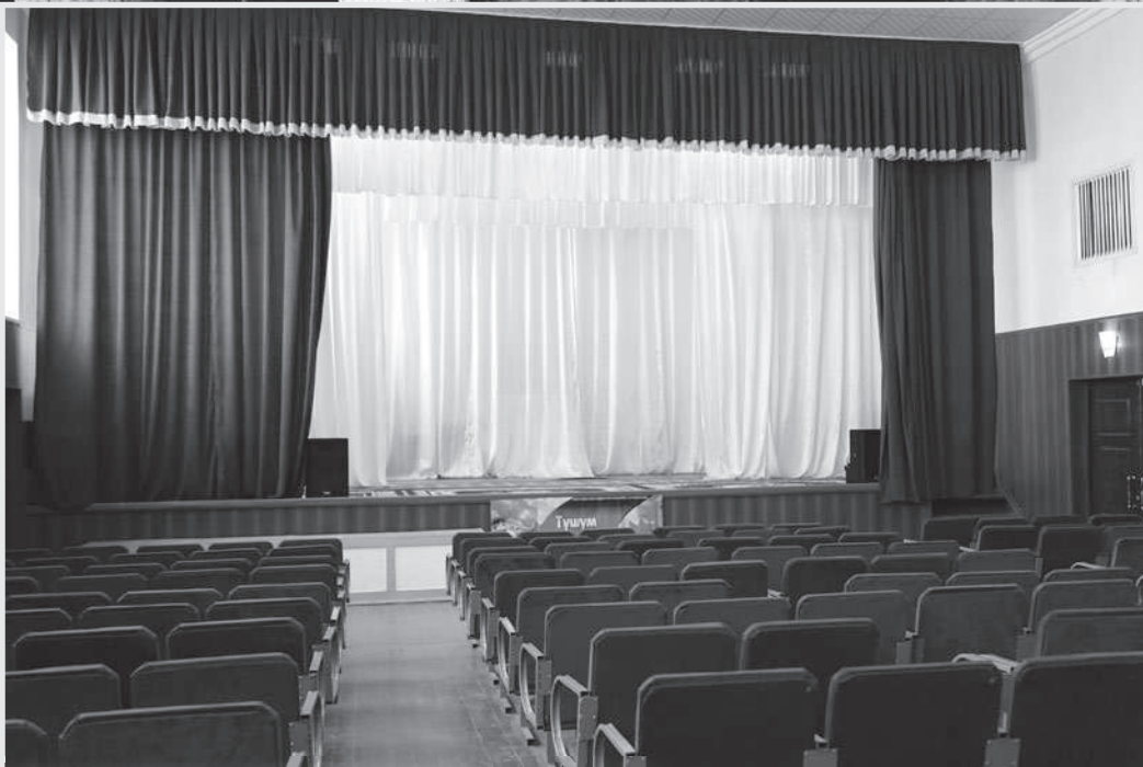
“Кумтөр” бөлүп берген грантка концерттик залдын отургучтарын жана көшөгөсүн жаңыртышкан.

Айыл башкармалыгын администрациясы да жайгашкан жергиликтүү клубдун оңдолгон имаратында бүгүнкү күндө баардык коомдук жана мектептик маанилүү иш чаралар, чогулуштар, майрамдар, концерттер өткөрүлөт. Бишкектен атайын артисттер да бары-