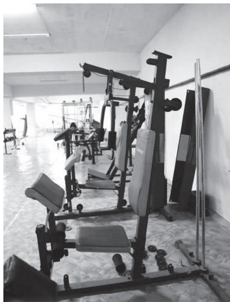
Тренажердук залдын ачылышы менен спорткомплекске келгендердин саны байкалаарлык өстү. Темир көтөрүп машыгуу үчүн бул жакка күнүнө 50гө жакын адам келет.

- Эгерде жергиликтүү бийликтер, ата-энелер жана кайрымдуулар өз аракеттерин бириктирсе, эки-үч жылдан кийин жаңы деңгээлди көрсөтөбүз, - деп жаштар командасынын машыктыруучусу уба-