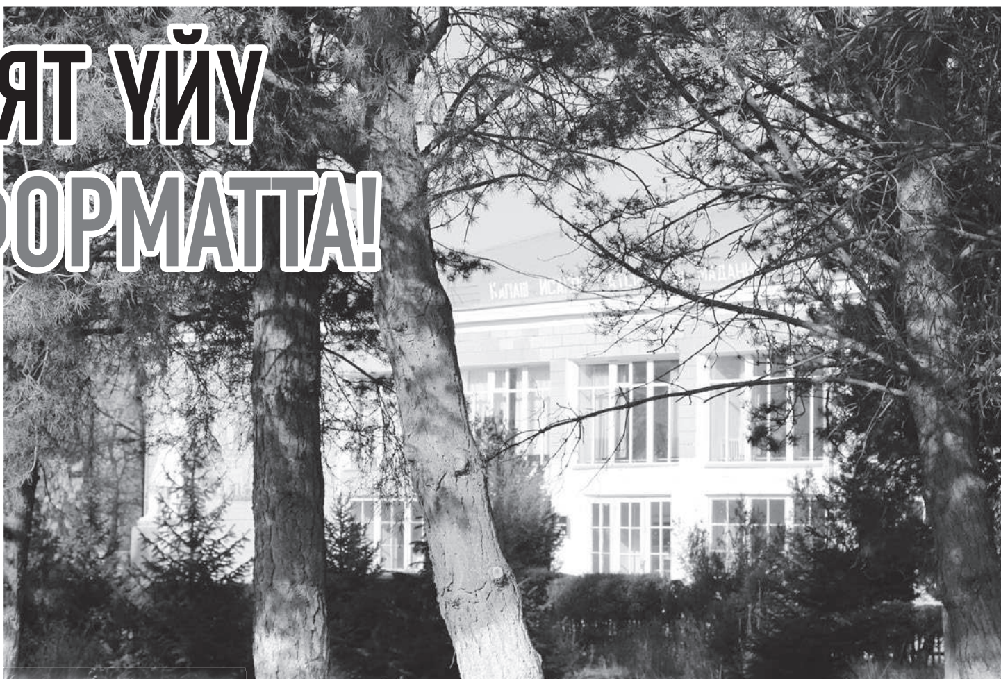
Кара-Коо айылындагы Маданият үйү 1966-жылы курулган.

Жергиликтүү бийлик көшөрүп кайрылып жатып мурдагы жылы республикалык казынадан заңкайган имаратты реставрация кылуу үчүн 1 миллион 900 миң сом кызыктыруучу грант бөлдүртүп алышкан. Бул акчага бир нече ай мурун полду алмаштырып, жаңы эшик-терезелерди салып, дубалдарын сырдап, вентиляция системасы жасалган. Ошондой эле жарык берүүчү жаңы приборлор орнотулуп, примеркалар оңдолгон.