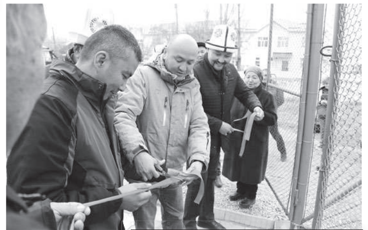
Жаңы аянтчаны ачуу аземине жергиликтүү бийлик жана “Кумтөр” компаниясынын өкүлдөрү катышты.