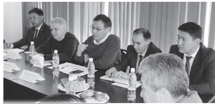
Караколдо “Кумтөрдүн” өлкөнүн социалдык-экономикалык өнүгүүсүнө кошкон салымын талкуулашты.

Бул маселеде кош көңүл эмес активисттерден баштап жергиликтүү бийликтин өкүлдөрүнө чейин баары бир пикирде экендиктерин билдиришти. Ысык-Көл облусунда тазалоочу курулуштарды алмаш-