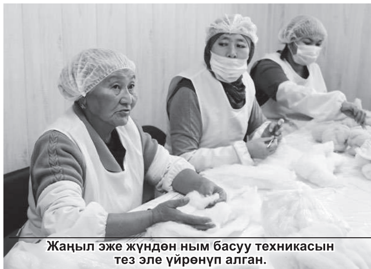
Жаңыл эже жүндөн ным басуу техникасын тез эле үйрөнүп алган.

Японияда жаралып, ийгиликтүү ишке ашырылган “Бир айыл – бир продукт” долбоору Эл аралык япон агенттинин (JICA) жардамы менен