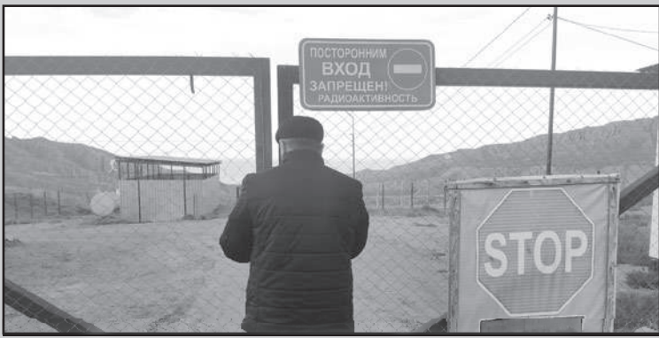
Каалгаларда эскертүүчү белги илинген.

Мурда уран калдык сактоочу жайы абдан начар абалда болгон. Азыр ал мындайча көрүнөт.