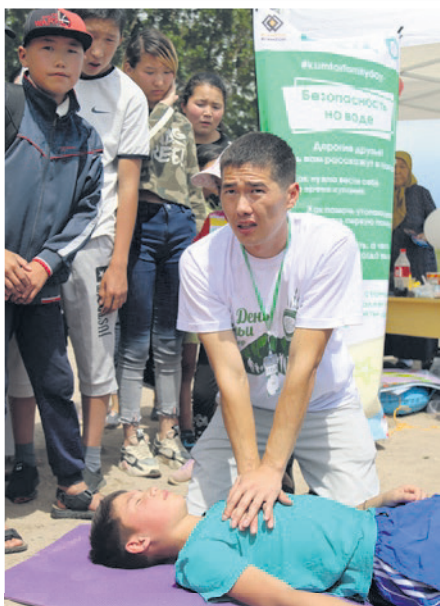
Чөгүп кеткен адамга биринчи жардамды берүү боюнча тренинг. Кичинекей балдар эле эмес, чоңдордун көпчүлүгү да күтүүсүз кырдаалдарда өзүн кантип алып жүрүүнү билбейт экен.