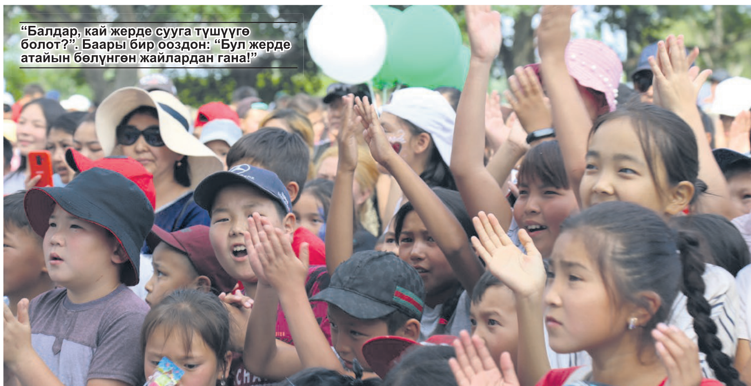
“Балдар, кай жерде сууга түшүүгө болот?”. Баары бир ооздон: “Бул жерде атайын бөлүнгөн жайлардан гана!”