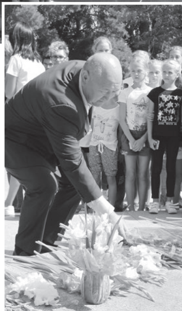
Эсте калчу жүрүшкө вице-премьер-министр Жеңиш Разаков да кошулган.

Ысык-Көл облусуна караштуу Түп районунун Күрмөнтү айылынын айылдык кеңешинин төрайымы кылып дайындалган убакта Токтогон Алтыбасарова өтө жаш эле. Ал эми 1942-жылдын август айында ал блокадада калган Ленинграддан келген 150 баланы багууга алган.