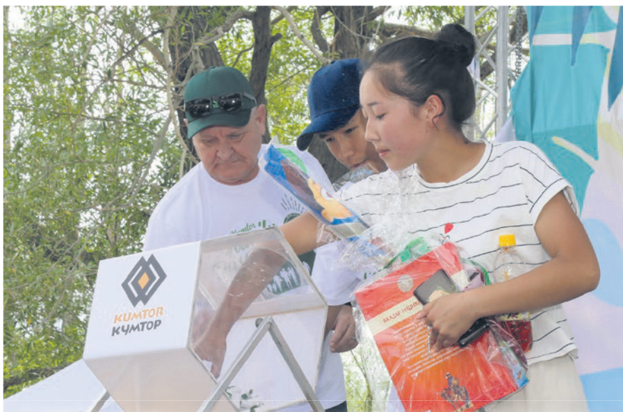
Майрам убагында лотерея оюндары өткөрүлүп жатты. Бактылдуу лотерея ээлерине белектер тапшырылды.