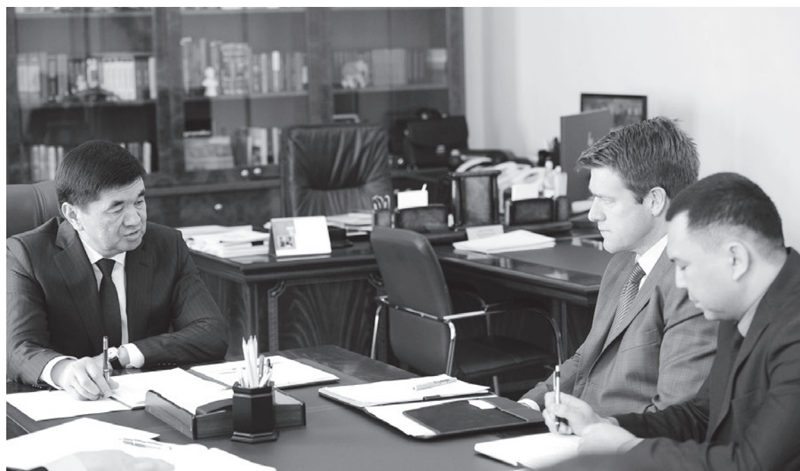
Скотт Перри акыркы жылда Кыргызстанга бир нече жолу учуп келип, кыргыз өкмөтүнүн башчысы менен жолукту. Бул сүйлөшүүлөрдүн жыйынтыгында «Кумтөрдү» чоң келечек күтүп турат деген үмүт жаралды.

Анда, келишим боюнча «Центерра» Жаратылышты өнүктүрүү фондун түзүүгө бир жолу 50 млн доллар жана кийинки 10 жылда, кенди пайдалануу мөөнөтү аяктаганча бул фондго жыл сайын 2,7 млн доллардан төлөп турууга милдеттенме алган. Бийликтегилер донордук салымдардын эсебинен «жашыл берметтин» көп