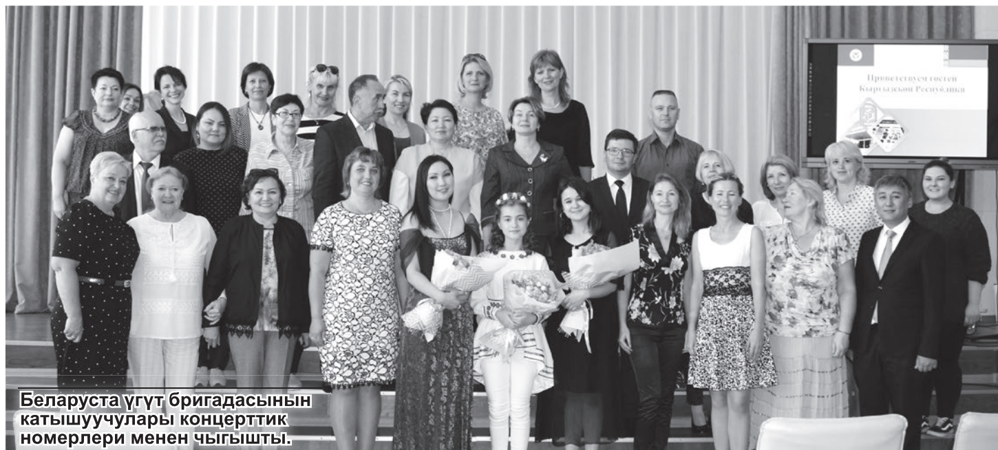
Беларуста үгүт бригадасынын катышуучулары концерттик номерлери менен чыгышты.

Витебск облусунда болгон эскерүү иш-чарасы Бешенковичи районунун борборунда болгон үгүт бригадасынын концерти менен жыйынтыкталды.