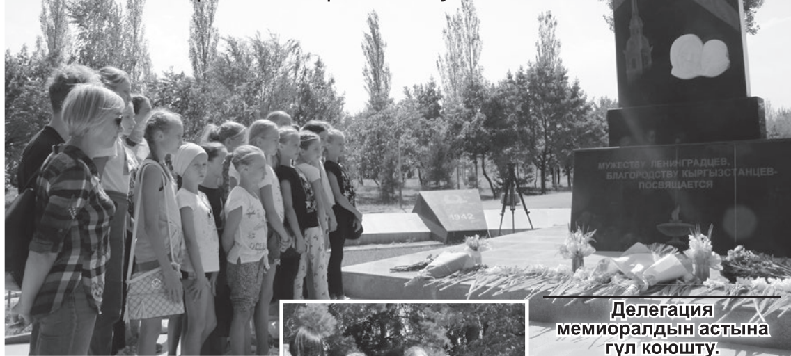
Делегация мемориалдын астына гүл коюшту.

Санкт-Петербург шаарынын “Экран” спорттук мектебинин командасы учуп кетүү алдында легендага айланган аялдын мемориалына гүл коюшту.