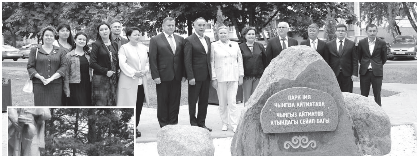
Минсктин ушул жердеги скверинде келечекте Чыңгыз Айтматовго эстелик тургузулат.

Маанилүү датага чейин дагы көп бардай сезилет, бирок кыймылдын активисттери эмитеден эле кийинки үгүт жүрүшү тууралуу ойлонушууда. “Кыргызстандын үгүт бригадасынын” жетекчиси мурунку жылдардагыдай эле президент Сооронбай Жээнбековдун