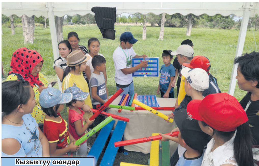
Кызыктуу оюндар жана көңүл ачуулар. Жеткинчектер рахаттануу менен сынактарга катышып жатышты.