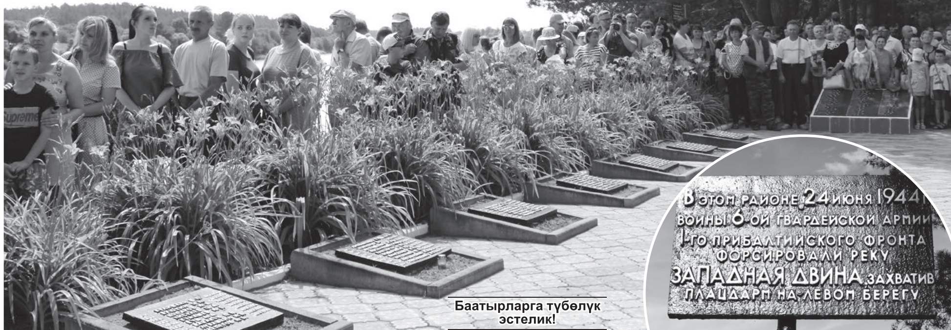
Баатырларга түбөлүк эстелик!

Патриоттук кыймылдын активисттери маанилүү датага туш келтирүү боюнча жыл сайын болуучу маршрутту пландоого киришишти.