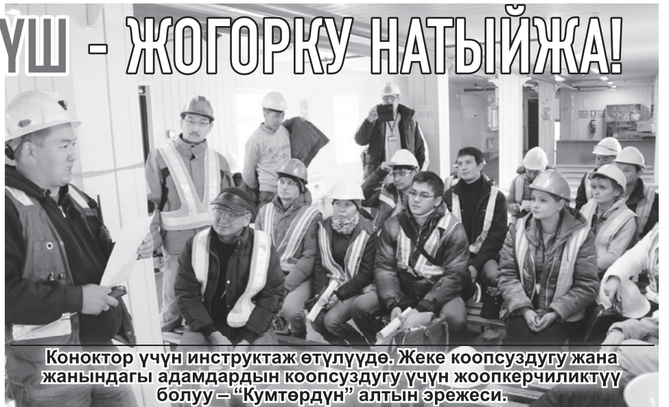
Коноктор үчүн инструктаж өтүлүүдө. Жеке коопсуздукту жана жанындагы адамдардын коопсуздукту үчүн жоопкерчиликтүү болуу – “Кумтөрдүн” алтын эрежеси.

Коопсуздук техникасынын маселери боюнча кумтөрлүктөр теория жүзүндө