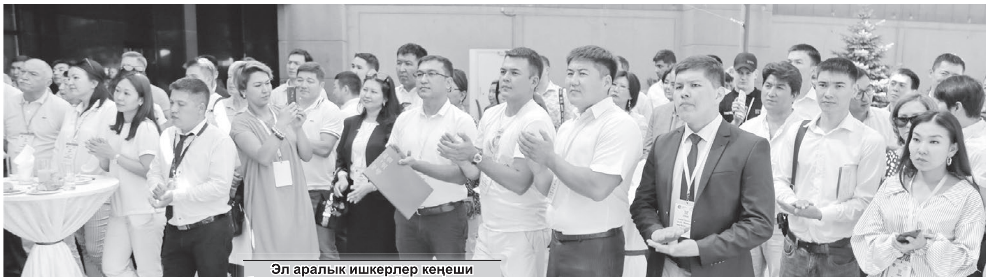
Эл аралык ишкерлер кеңеши бизнестегилердин байланышы үчүн уникалдуу аянтча түзүп берди.