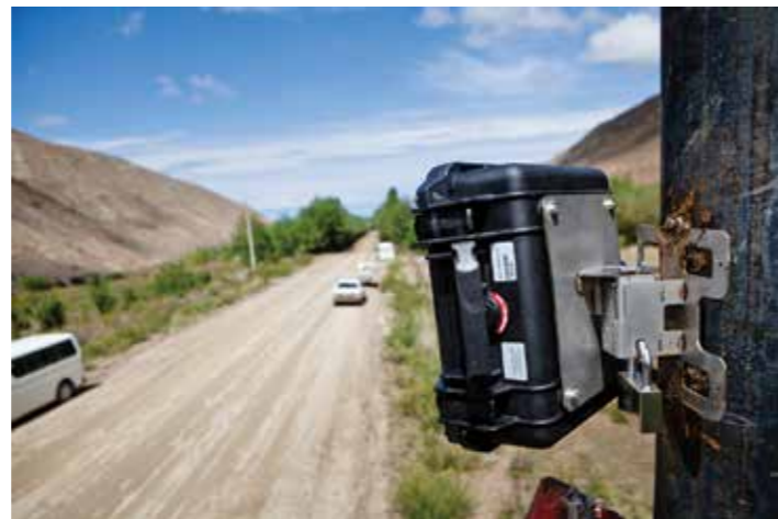
Атайын эсептегич технологиялык трассада өткөн унаалардын саны, көлөмдөрү жана багыты жөнүндө маалымат топтойт.

Жүргүзүлүүчү иштердин максаты – чаңдын курчап турган чөйрөгө таасиринин деңгээли жөнүндө илимий тастыкталган маалыматтарды алуу. Бардык натыйжалар жана өлчөөлөр ай сайын «Alex Stuart» көз карандысыз лабораториясына жөнөтүлөт. Маалыматтарды алганыбыздан кийин, алардын негизинде негизделген тыянактарды чыгарууга жана зарыл чараларды көрүүгө болот.