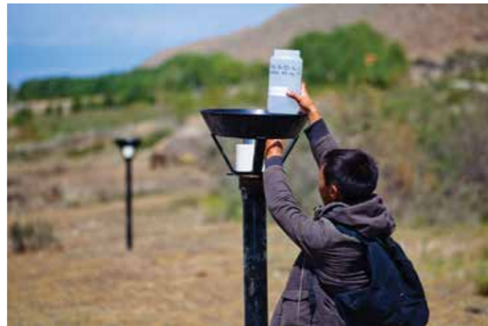
«Жашыл Ой» эколагеринин катышуучусу, чаң кармагычты орнотуп жатат.

БИШКЕК КЕҢСЕСИ 24 Ибраимов көч., 10-чу кабат, 720031 Кабылдама: 0312 90-07-07