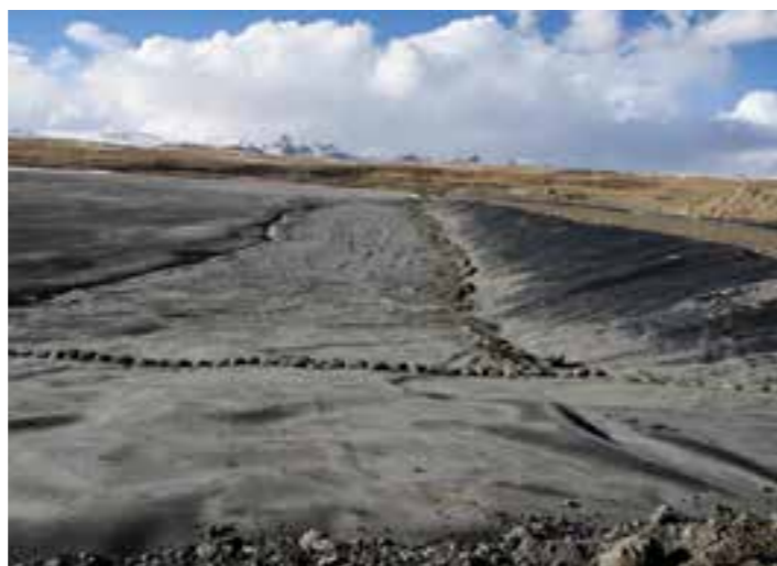
Жогорудагы сүрөттө, жырып кетүү болбосу үчүн коюлган калың тоскуч

Дамба боюнча, анын ичиндеги калдыктардын химиялык түзүмдөрү, өзгөчө кырдаалдын жана кенди жабуунун пландары, мониторингдердин жыйынтыктары боюнча көбүрөөк маалымат алуу үчүн, бизге кайрылыңыздар. Баардык түйшөлткөн суроолорго, сөзсүз жооп беребиз.